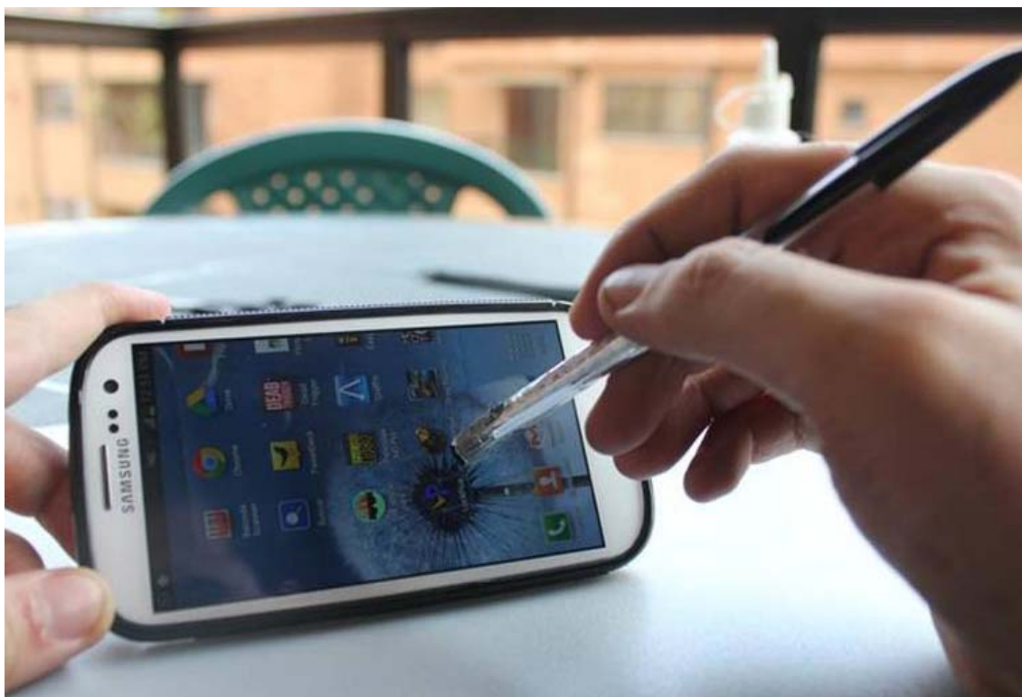
Imagen del uso del lápiz de bajo coste para pantallas táctiles.