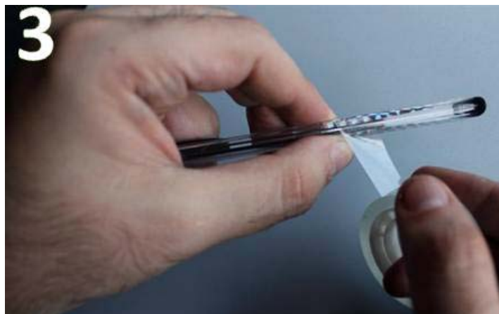
Imagen de la fijación del papel metalizado mediante cinta adhesiva.