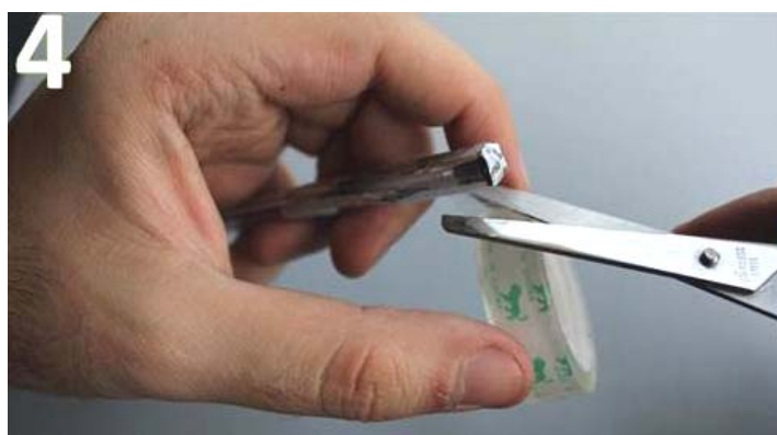
Imagen del corte de la cinta adhesiva.