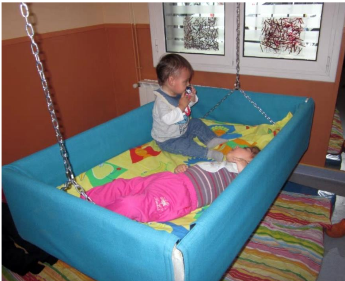
Imagen de dos niños ocupando la hamaca vestibular suspendida del techo.